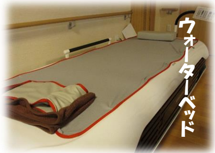
ウォーターベッド