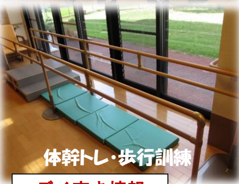
体幹トレ・歩行訓練