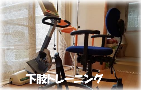
下肢トレーニング