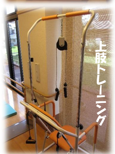
上肢トレーニング