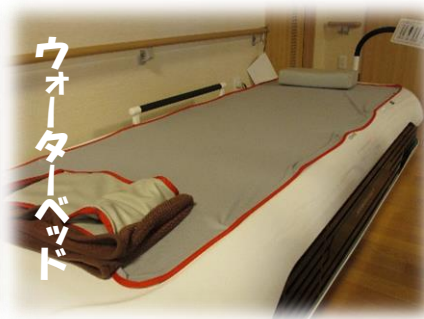
ウォーターベッド