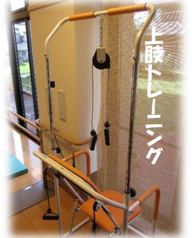
上肢トレーニング