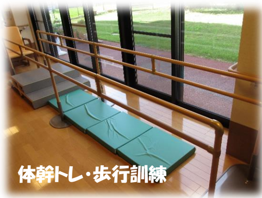
体幹トレ・歩行訓練

ケアサービス神姫あおやまデイが利用者様の状態に応じた 「 機能維持・向上訓練 」をしてること、 ご存知ですか!!