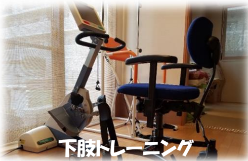
下肢トレーニング